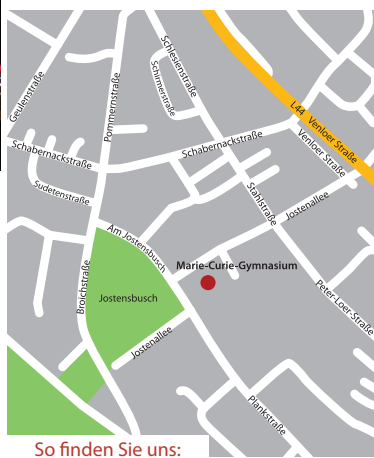
So finden Sie uns: